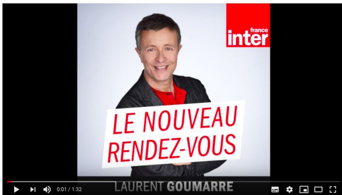
BOTIBOL - Le Nouveau Rendez-Vous | France Inter